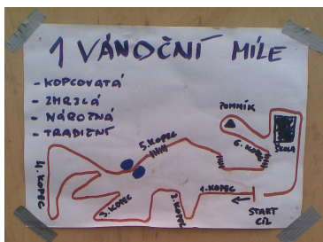
Obr. 1 Ilustrační náčrtek trati

Lobežský botokros pořádá každoročně již řadu let Klub orientačních sportů Slavia VŠ Plzeň. Tradičně se startuje 24.12. v dopoledních hodinách. Závodní trasa vede lobežským parkem a pro zvládnutí jednoho kola je potřeba překonat vzdálenost jedné míle. Podle kategorie a pohlaví se běží buď jedno nebo dvě kola. Na trati může závodníky překvapit několik kopečků a několikrát také schody. Dále bývá trať vylepšena dle počasí bahnem, sněhem či ledovkou, popřípadě jejich kombinací.