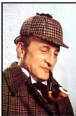
S hledáním bývalých členů nám pomáhal i sám slavný Sherlock Holmes.

Tak jako tak nás těší, že se nám podařilo dost pozvánek udat. A doufáme, že se většina oslovených objeví.