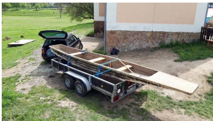
foto_2 - Čerw v roli testovacího plavce

Bonus: foto_1 - první využití Karlova řidičského oprávnění skupiny E