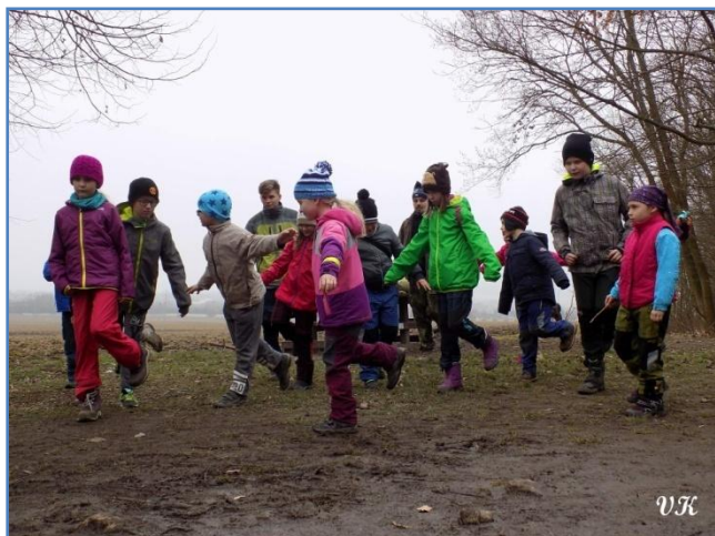
Stoj na noze - boj o mapu

Venku jsme hráli Buldoky, pak jsme šli na hvězdárnu. Pozorovali jsme měsíc a souhvězdí. V půlce toho přišel Řízek se Zajdou. Ten vypravěč měl