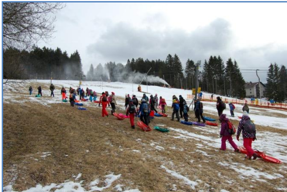
Ale sních jsme měli!!

dostala samolepku. Když mělo družstvo 3 samolepky, tak se mohlo ohřát v hospodě.