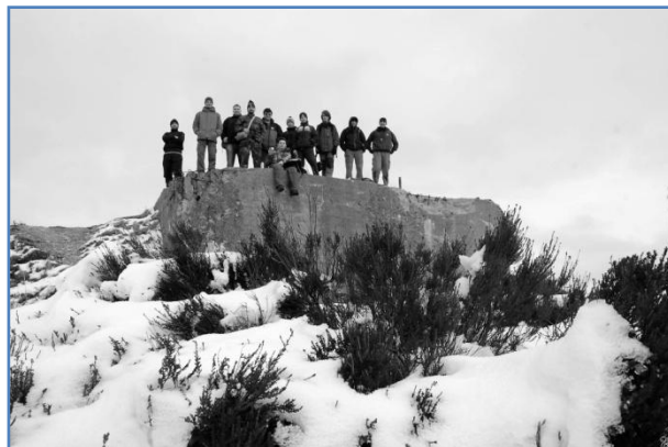
Dobytí severního pólu